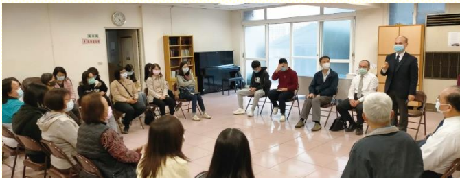
傳福音前的爭戰禱告

『當以色列人出埃及，到了西乃山時，摩西看見異象，就為神建造會幕；接着他們以迦南為目標，開始曠野的行程。他們往迦南，不是沒有見證，沒有中心；不是兩、三百萬人，在曠野蕩來蕩去，至終就蕩到迦南地。不，他們在曠野的行程，不僅有紀律、有組織，並且有中心，就是神的帳幕。』(摘錄自新路實行的異象與具體步驟)。因此，傳揚福