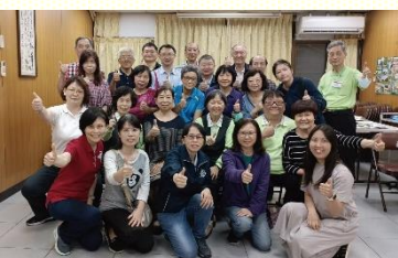
開展隊與聖徒合影

為了學員們前來配搭，本地聖徒在學員們的接待與住宿上多有禱告與尋求，原本因接待家庭不足，學員需要住在會所，但有聖徒靈裏不安，認為住會所，對待客人沒有熱誠。感謝主，為學員豫備了兩個家，在接待客旅上，經歷了『待客要追尋機會』（羅十二13）。