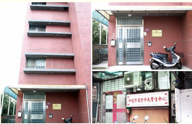
十會所及中大學生中心

桃 園市召會十會所於中壢區中央路 168 巷 9 號。為一棟四層樓建築：一樓為聚會場地、廚房。