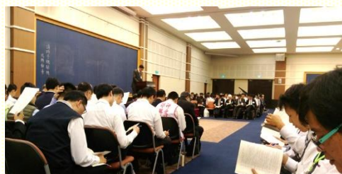
春季全臺弟兄事奉成全集調

桃 園市召會今年參加全臺弟兄事奉集調，人數共有一百六十四位。這次弟兄集調信息共八篇，每一篇都講『事奉』，交通到我們的事奉若是在天然裏，就是在肉體裏，不是在主裏，也就是用凡火在事奉。我們的天然雖然滿有幹才與能力，在外面看來或許把事情作得很標準也沒甚麼問題，但與