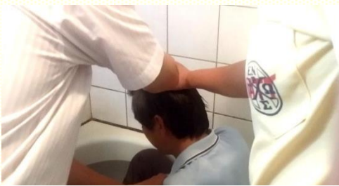
走出宗教迷境，享受與主生機聯結

未得救之前，很難相信自己會堅定的信入主。因着從小對不同宗教的好奇與涉獵，使我一直