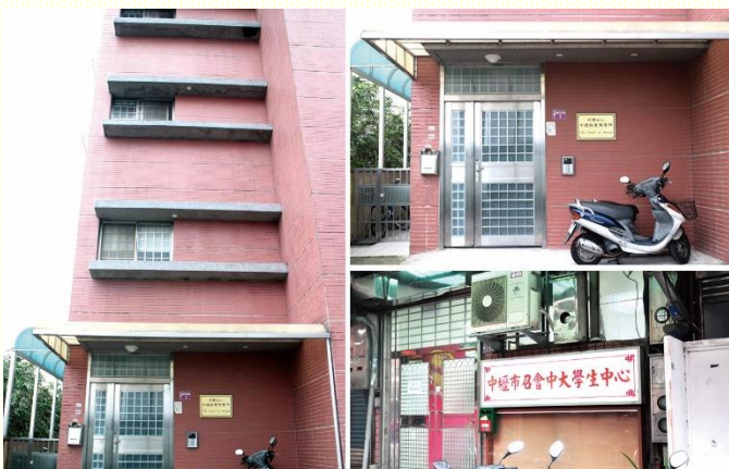
十會所及中大學生中心

桃 園市召會十會所於中壢區中央路 168 巷 9 號。為一棟四層樓建築：一樓為聚會場地、廚房。