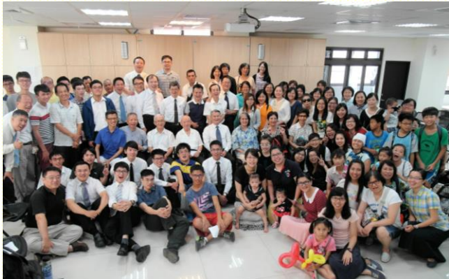
十會所聖徒外出事奉相調合影

今年八月六日，十會所借用十六會所之新會所，舉辦下半年外出事奉相調，上午事奉交通，下午到附近景點相調。全會所共有一百一十六位聖徒參加，達到主日基數三分之二。這次事奉聚會的信息傳輸、事務配搭，都由青職拿起。每堂聚會分享，聖徒人人響應，一同進入事奉負擔。真為這幅榮美建造的景象，讚美主！