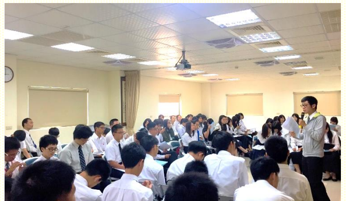
學生們穿著整齊，認真進入信息

希伯來書十章二十五節：『不可放棄我們自己的聚集，好像有些人習慣了一樣，倒要彼此勸勉；既看見那日子臨近，就更當如此。』這句經節之前聽了很多遍，因為自己常來聚會，所以並沒有特別的感覺，但弟兄卻加強的題到為甚麼聚會不是每次都有享受？不是這堂聚會不好，乃是自己沒有豫備好！對此，我纔特別有感覺，原來不只是要來聚會，還需要認識如何聚會。