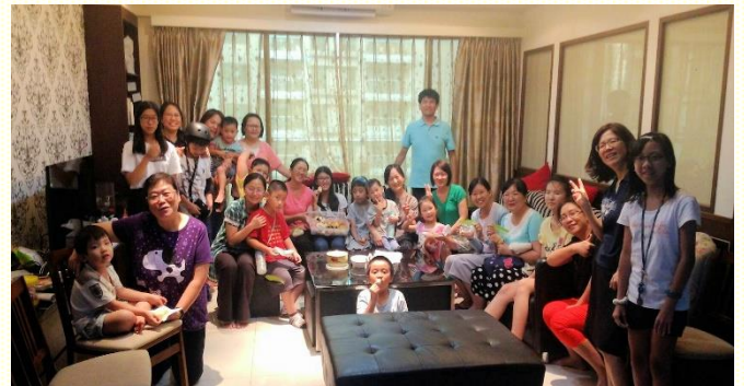
十三會所社區兒童排

雖孩童年齡差距大，但性格操練卻無年齡限制，課程都以性格三十點為內容。孩子剛進到兒童排時，一刻也無法安靜上課，總是望着外面的玩伴且進進出出。經過一段時日後，孩子們不僅上課認真，大聲呼求主名和禱告，勇敢發問，踴躍回答問題，且都早早在活動室門外等着上課，也會彼此互相邀約參加。在社區兒童排裏的一個家，他們兩個