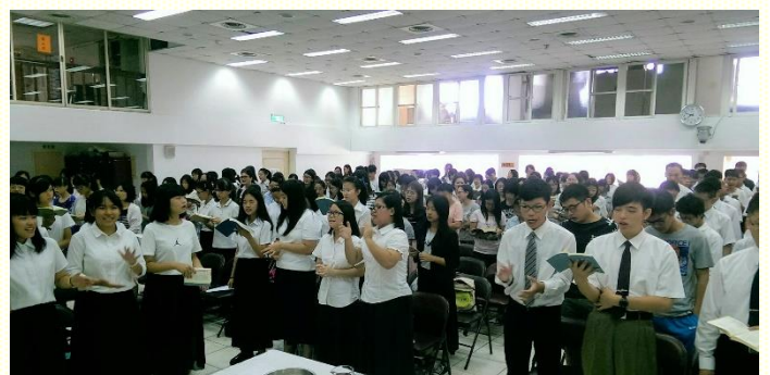
秋季桃園市召會中學生期初特會

話豐富富住在裏面，靠此勝過惡者。世界與神的旨意對立，因此我們不要愛世界，使世界在我們裏面沒有任何地位。現今在主的恢復中，青少年們在生命上要長成喫乾糧的人，對主的話有經歷，願意認真對待話與靈，留在神的面光中，倒空自己，來親近接觸神，接受生命的分賜，享受在至聖所全備