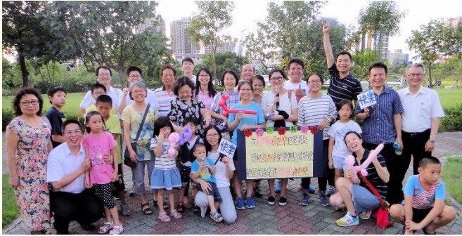
青埔青塘園傳福音

爲着下半年開展行動的方向，本會所規劃了青埔的福音開展、大學的福音節期以及社區開展，藉此恢復人人過傳揚福音、彼此牧養的生活。也盼望藉着堅定持續的實行，建立人人、週週出外傳福音的習慣，使傳福音不再只是一時的活動，而是我們的生活。