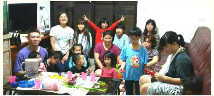
聖徒們週週熱切的帶着孩子來兒童排

暫停聚會，但姊妹意志堅剛，完全不受打岔，兒童排仍照原訂時間進行。感謝主，弟兄姊妹們也不受天氣影響，憑着信心，陸續帶孩子們來到姊妹家。儘管每次兒童排聚會屢屢遇到雨天，但聖徒們依然週週熱切的帶着孩子們來與主耶穌相聚。目前參加姊妹家中兒童排的人數，有十四位兒童，其中一半是福音孩子。在第二次聚會時，一位福音媽媽就配搭為孩子們說故事。