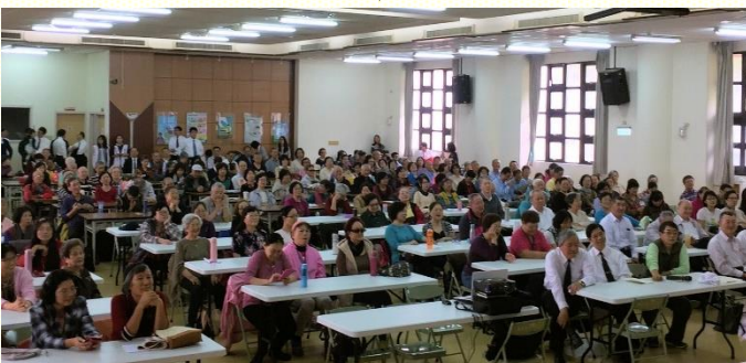
全召會長青聖徒相調聚會

相調一開始是北區聖徒的詩歌展覽和見證分享，合唱臺語詩歌『甲主作伙行』、『我的救主』及『唱一首天上的歌』，眾人都站起來同聲歡唱，每位靈裏高昂。看到年長的弟兄姊妹們賣力的唱着詩歌，特別叫人受鼓舞、得激勵。