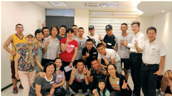
陸軍專科學校受浸新人合照

這 學期的陸軍專科學校福音聚會，六會所共舉辦兩次，一次在今年十月四日週三，一次在十一月十八日週六。兩次聚會中，共來了六十多個陸專學生，總共受浸得救十七個平安之子。藉着弟兄姊妹們週週禱告，同心合意配搭服事話語、詩歌、飯食、受浸、清潔、車輛及其所有的一切，讓主有路進入這些學生裏面，作他們的生命與救主，讚美主！