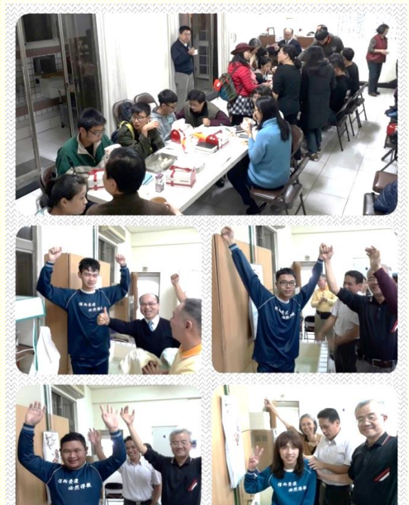
開南大學福音愛筵並新人受浸

中原學生和聖徒第一次以『福音棚』的活動方式，帶了九位新人受浸。第一站為詩歌歡唱，藉着『呼求主名』相關之簡短輕快的詩歌，使福音朋友的心敞開，也能很自然的帶他們呼求主的名，點活他們的靈。第二站是見證分享，社區聖徒和學生一同配搭，使經歷更豐富，讓福音朋友感覺到主是又真又活的神。聽完見證後，以小組的方式傳講『人生的奧秘』，向同學們分享神的創造到神的分賜，並直接的題到受浸的真理，帶領人過受浸的關。主真是在這樣的福音行動中得榮耀！也為了每年臺島青年得一萬的負擔，中原學生從十一月到年底，每週都有福音茶會，盼望在年底能穀達到目標。