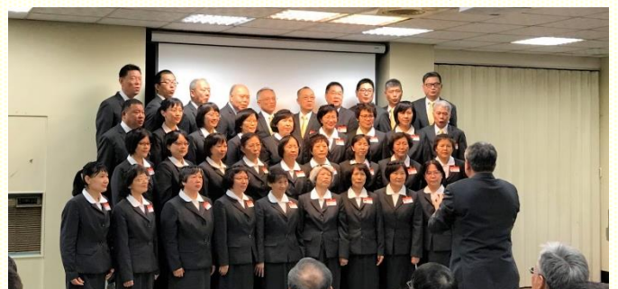
壯年班於二會所展覽

接着有譚弟兄交通親身參訓的經歷見證，以及弟兄們的呼召與加強，激動多位聖徒拿了報名表，有心願於近年內參加訓練，更有三位姊妹將報名參加下一期的壯年班訓練。阿利路亞，榮耀歸主！願愛你的人，如日頭出現，光輝烈烈。