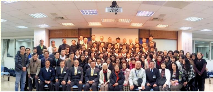
壯年班於七會所與聖徒合照

在七會所的展覽，我們滿心歡喜的迎接五十位學員與同行輔訓來到。他們面帶基督榮光、精神奕奕，有秩有序的進入會場。在『愛中牧養』和『讓我愛』詩歌中，穿插着學員的蒙恩見證。聖徒們聚精會神聆聽神新造的工作：有學員因天然老舊光景，過着沒負擔、不冷不熱、守規條的事奉生活；但藉着定時禱告和屬靈追求，如今能在挑旺的靈裏服事主。還有位擔任組長的學員，被曝露只偏愛那可愛的，並盼望別人以善回應自己；但藉着訓練的操練，釘死天然的生命，轉回到調和的靈裏，向