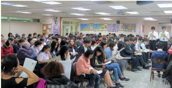
四會所集中主日聚會

自 今年初，弟兄們有鑑於聖徒光景停滯不前，盼望衆聖徒能毅然恢復對主的享受，與同伴過活力的生活，並實行神命定之路。因此，自五月起，弟兄們帶領聖徒過『晨晨復興，日日得勝的生活』，不僅是個人需要有晨興，更是需要與同伴一同晨興，建立晨興網，藉着天天享受主，週週走出去，過福音與牧養的生活。