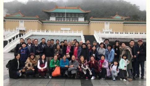
與北美聖徒於臺北故宮博物院合照

次日上午，北美聖徒前往臺北故宮博物院參觀。有少數聖徒未入內參觀，陪同的弟兄們再與他們有更多的交通。弟兄們發覺，在臺灣的我們可能