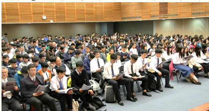
中學生特會主日聚會

第三天的結語，題醒我們要作個敞開的器皿，惟有我們完全敞開的來到特會，真理的話纔能作