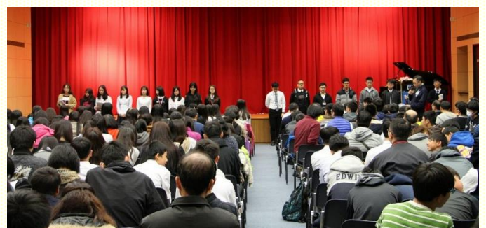
中學生特會高中生申言展覽