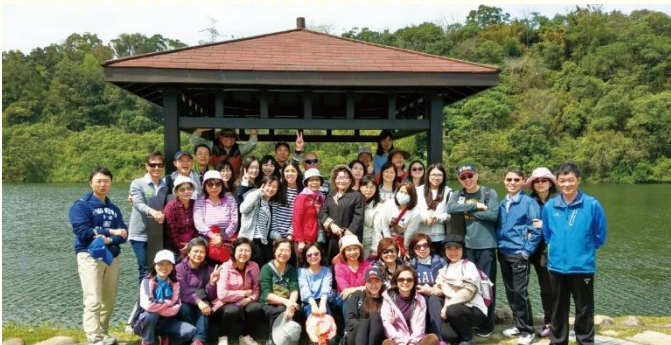
弟兄姊妹在三坑自然生態公園喜樂合照

時序進入二〇一八年的春天，弟兄姊妹們交通規劃，今年每一季本會所安排戶外相調一次，使各小區的聖徒們藉着多而甜美的交通，彼此扶持、安慰和鼓勵，帶進身體的建造與召會的往前。