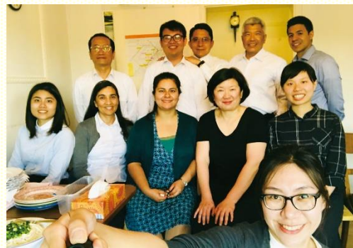
與當地聖徒及學員用餐前合照

弟兄帶來目前德國開展的負擔：第一，在衛星城市建立金燈臺；第二，得着德國校園青年；第三，得着社區的家；第四，牧養波斯語聖徒。盼望在臺灣的聖徒們也能為着以上負擔持續代禱。主在帖撒羅尼迦前書一章五節曾說：『因為我們的福音傳到你們那裏，不僅在於言語，也在於能力和聖靈，並充足的確信』，盼望我們在此福音的傳揚是藉着那靈充滿和充溢，使基督在我們身上有自然的流露。