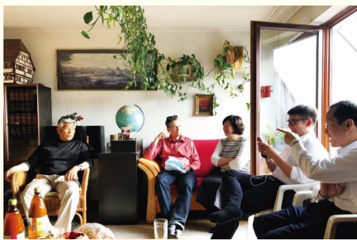
與當地聖徒及學員交通相調