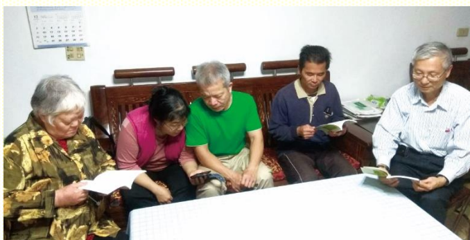
去社區聖徒家中陪讀經

九月份開始，在本地每週一的弟兄事奉交通裏，跟隨負擔，開始一一察看各區各項聚會的點名情形是否確實，結果發現常有遺漏點名的狀況。檢討過程，也認識新人和不常聚會的聖徒，瞭解他們的情形，後續安排合適的聖徒去看望，有人性的顧惜和神性的餵養。藉此檢討交通，亦題醒服事的弟兄們要看重點名，不要漏掉主所託付我們的小羊。