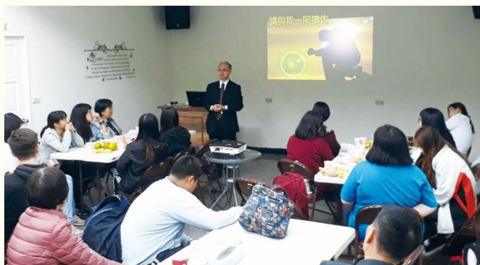
銘傳大學聖經真理講座

在 進入大學以前，我沒有傳福音的經驗，也因為個性關係而害怕傳福音。在這次福音節期中，主光照我，我們每個人所能給主的，並不是在於我