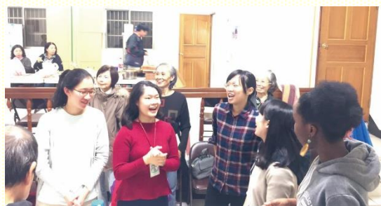
開南大學期中福音聚會

園的福音工作，得着許許多多向祂絕對的青年人；也願在召會中並在基督耶穌裏，榮耀歸與祂，直到世世代代，永永遠遠，阿們。