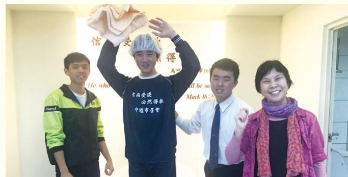
新人受浸後喜樂合影

園裏，廣發福音單張接觸人，傳講人生的奧秘。除了大學聖徒有分於福音開展的行動，更有社區聖徒前來配搭。特別是弟兄姊妹釋放靈禱告和傳福音榜樣，大大激勵學生們，不以福音為恥，福音的靈更被加強、焚燒，並認識福音本是神的大能，要