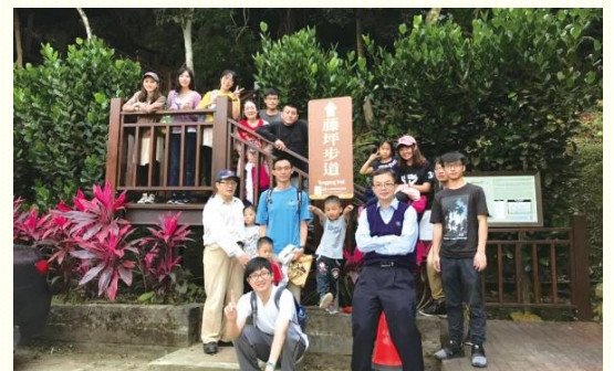
三會所青職苗栗相調

三會所則規劃在十一月的第二個週末到苗栗踏青，藉此機會邀約久不聚會的青職聖徒與福音朋友。為着相調，小排的時候列出邀約名單並禱告，也主動聯繫名單上的人位。感謝主，相調當天除了有小排的固定成員參加，還