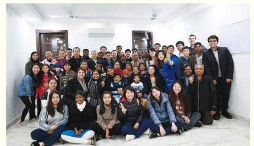
美國、印度、臺灣聖徒合照

在開展的後期，甚至有八位聖徒從美國加州河濱市（Riverside）前來加強開展。我們於