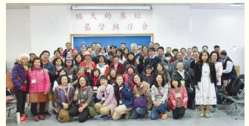
與斗六市召會主日相調