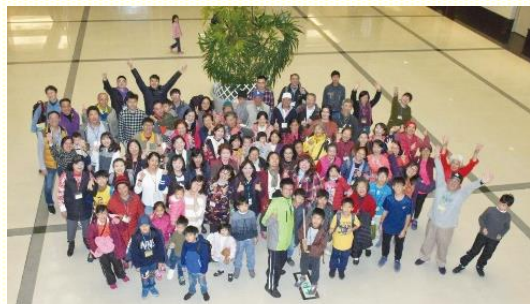
在相調中心團體合照

本次相調共有三部遊覽車，一百二十四人報名，其中有九位福音朋友。於中部相調中心住宿兩晚，安排有兩晚的年終