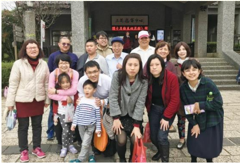
新增小排外出相調

隨即定於三月初，邀約聖徒（大部分未入排）開四部小車，至新北市召會三芝會所相調。當天上午先一同擘餅，隨後一同分享主應時的說話，弟兄姊妹在身體中得供應也得加強。中午享受豐盛的愛筵，下午弟兄姊妹帶我們去賞櫻花。本會所聖徒彼此之間，也由原來幾分陌生感，變得漸漸熟悉。