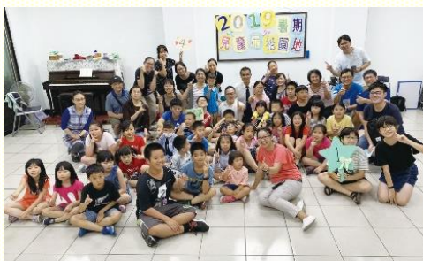
五會所的暑期兒童品格園

(二) 福音朋友參與，帶進社區福音。這次有多數兒童是來自未信主的家，我們有負擔帶領他們調入召會生活。這些兒童剛開始有些生澀，隨着挑旺靈，他們的心也敞開，完全與我們調在一起。最後的親子福音茶會，介紹召會兒童工作的豐富，邀約兒童、家長後續加入我們的召會生活，家長都非常認同且願意參與。