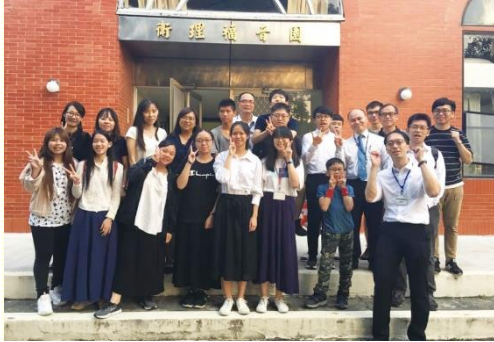
參加北區中學生暑假特會

『二靈調和成為一靈』。弟兄們帶領青少年運用靈、操練靈，摸着是靈的基督，使青少年操練脫開規條，被