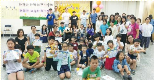
二會所的暑期兒童品格園

這 次二會所的暑期兒童品格園，在身體的代禱中，由一羣年長、中壯年、青職、青少年的聖徒與兒童一同配搭服事。在人看來，實在是個個軟弱，處處缺乏。但大能的神看中我們的同心合意，祂以全豐全足的恩典，在靈中加強每一位聖徒，使得七月六日一整天在歡樂的詩歌中，顯出有次有序、單純順服、彼此幫補的景象。除了參與的孩童個個歡喜，配搭的弟兄姊妹更是從中經歷『祂必擴增，我必衰減』，帶下無比的祝福，眾人靈中喜樂歡騰！