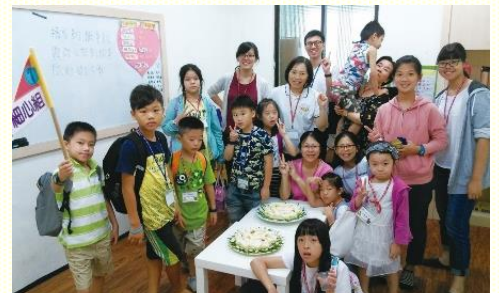
十四會所的暑期兒童品格園

雖然有些會所還在起頭的階段，但藉着彼此交通與蒙恩分享，各會所都得到幫助，也在許多禱告交通中得着服事的信心。有的會所，由聖徒呼召青職、大專和青少年聖徒一同盡功用，使得該會所各個年齡層都投入配搭，全員一同參與。