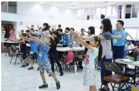
一會所品格園詩歌帶動唱

因着有第一次的經驗，眾人在各面都進步許多。尤其在邀約福音兒童的事上，截至七月底，各會所合計參