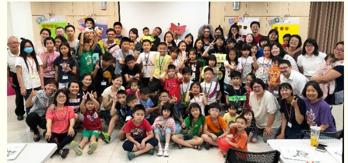
十六會所的暑期兒童品格園

是第一次當隊輔，看到調皮搗蛋的孩子們，一度想發肉體，但主說：『讓小孩子到我這裏來，不要禁止他們』。主使我轉回靈裏，並為着這次服事有所禱告。感謝主，不再單看孩子的缺點，改為珍賞並讚美他們，於是主在他們身上變化並作工，使他們成為一班積極操練靈的小神人。在闖關時，看見他們認真的背誦主的話，使我無比感動。當中還有兩位小朋友，奉獻自己在暑假操練讀聖經；若今天是我，肯定辦不到。求主記念他們這樣的心志，也保守這班愛祂的小神人，能更加積極操練勤和細的性格，並實行出來。感謝主，使我有分於這次品格園的服事，阿們！