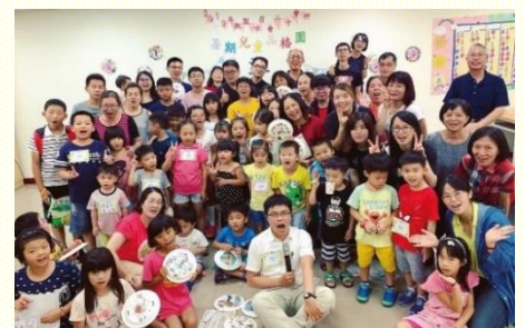
二十會所的暑期兒童品格園

此 次非常珍賞各領域的弟兄姊妹，竭力擺上自己的專長；小子是配搭園地的場地佈置。因二十會所第一次舉辦，常需向各會所請益、交通。起初，本想照自己的個性『不麻煩別人，凡事自己來最快』而行動。但在身體的配搭中，大家將自己的感覺交通出來，而願意放下自己，不照着自己活。如此，剛成立不久的小會所在聖徒們的扶持中，順利完成此次的品格園。藉此接觸許多兒童及福音家長。讚美神！我們雖然弱小，但當我們願意獻上五餅二魚，神都為我們擘開，成為可以供應生命並祝福別人的管道。阿利路亞！