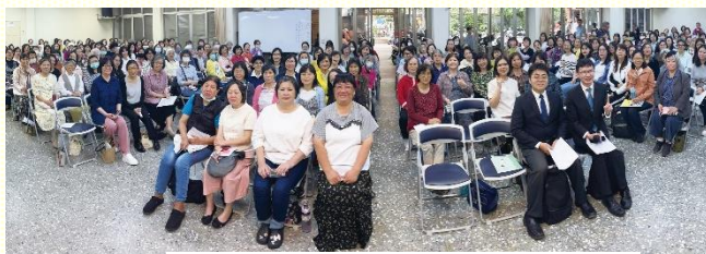
南大區姊妹相調聚會合影