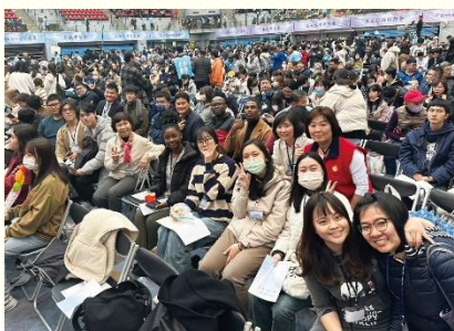
參加青年大會之聖徒合影

此次大會以『宇宙的奧秘—人生的意義』為主題，盼望青年人在福音和真理中被成全，豫備自己成為神手中合用的器皿。此次大會吸引了來自臺灣北部各地超過