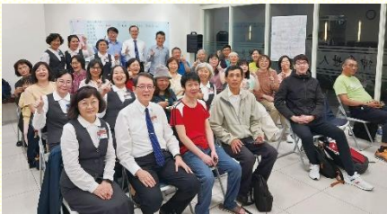
壯年班學員與配搭聖徒合影

感 謝主，藉着壯年班的加強與眾聖徒的配搭，南大區在文化國小及聯新醫院生活圈的開展得着神豐富的祝福，展現出基督身體服事的美麗光景。這次的開展不僅使主話得着擴展，更為當地召會生活注入新的活力與方向。此次開展地點為文化、平安商圈，涵蓋義民里、義興里、新榮里、廣仁里、廣達里及平興里等六個里區。開展自四月