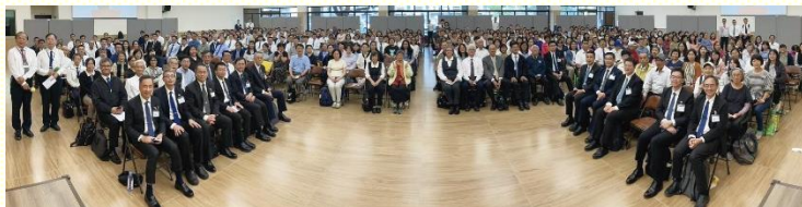
全臺青少年服事交通聚會合影

目前全臺得榮少年總數共有一千七百八十四位，得榮少年家庭有一千三百一十二個。得榮少年專案至今已兩年多，對於這樣的服事我們要有三個轉。第一，得榮少年服事不是慈善活動，不光有關心、顧惜，更要帶少年人進入靈和話。第二，不僅服事得榮少年，更是要帶得榮少年的家全家得救。第三，得榮少年服事不是基金會的專案，乃是區排繁增的路。所以得榮少年的服事不重在上完基金會所規定的課程，乃重於與福音少年的接觸。藉着每次的家聚會，關懷者能彀審核對象是否為平安之子，進而帶領福音少年及全家得救並進入召會生活。