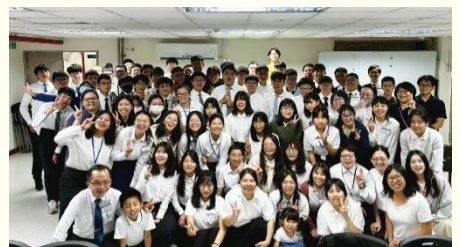
大專期末特會合影