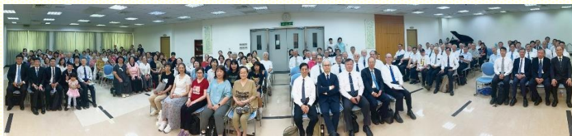
聖徒成全結業展覽聚會合影

時間，在三分鐘申言裏有經節、真理要點及經歷應用；並用靈來為主申言，好使我們能為神說話，把神說到人裏面。在書報班，聖徒們進入以弗所書生命讀經，看見每一位聖徒都有那一分神所賜的恩賜，為着職事的工作，為着建造基督的身體。為使身體長大，需要接受成全和訓練。在新路班，為着福音的緣故操練實行活力排，首先要有二到三位活力伴的禱告；其次要列出名單並且認罪悔改，有拼上去的禱告；第三和活力伴看望，實行送會到家餵養新人；第四在現有的排中實行作活力排，好使我們成為有活力的人，實行神命定之路。