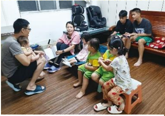
於聖徒家中的兒童排

歌 羅西書三章十五節：『又要讓基督的平安在你們心裏作仲裁，你們在一個身體裏蒙召，也是為了這平安；且要感恩。』