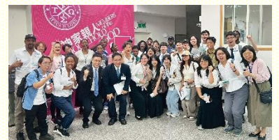
桃園外語生聖徒合影

實在珍賞這次整場特會—從個人對基督的享受與分賜，延伸到團體在一神裏的召會生活。這樣的交通引導外語學生，將屬靈的實