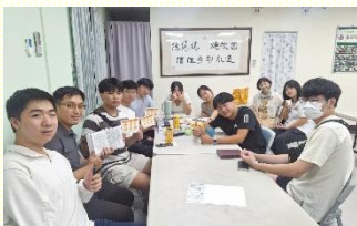
邀約新生陪讀聖經

感謝主！在這次的期初福音節期中，深刻經歷話語的能力與在基督身體中的配搭。本學期的開展着重於『陪讀聖經、堅定牧養』。我們抓住新生訓練與社團博覽會的時機，在校園擺攤、發問卷、送書籤與邀請卡，主動接觸新生，尋找對聖經有興趣的人。福音節期間，南大區各校共接觸學生超過三百人，其中九十一位表達願意讀聖經，三十七位仍持續陪讀，並已有六位藉着陪讀得救受浸！一位姊妹見證：『我們不只是邀人喫飯，更邀人讀聖經；結果對方更願意持續來，因為主的話有吸引的能力。』