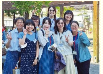
姊妹們於特會中合影

信息題到神為召會所定規的路是非拉鐵非的路，就是弟兄相愛的光景。得勝者不是很有能力的人，而是注重生命過於工作的人，啓示錄三章說到：『…稍微有一點能力』，我們需盡力為主而作。一位年長弟兄在心臟手術後仍說：『我盡我的一點能力，每早晨團弟兄們來禱告，有機會就去傳福音。』聖徒的榜樣題醒我們，在審判臺前，主不是問我們作多少工，乃是問我們是否盡力。