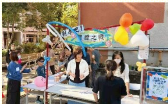
兒童朋友日闖關活動

北 大區於十一月十五日上午，在武陵高中舉辦『健康生活—兒童朋友日』，聖徒們為着這次行動，列名單、禱告、發單張，邀約平常接觸的福音家庭，並與各會所一同禱告、交通與配搭當天的服事。二十一會所共有三十六位聖徒、福音家長與兒童參加，其中包括十一位福音朋友（福音家長六位、福音兒童五位）。