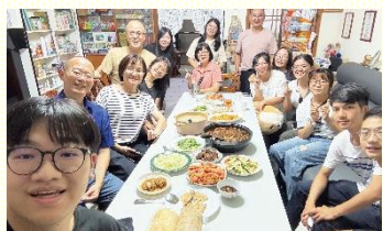
與屬靈照顧家合影