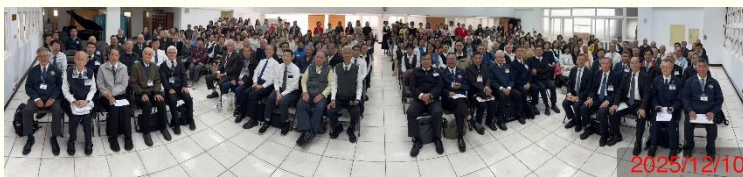
週中聖徒成全結業展覽聚會合影