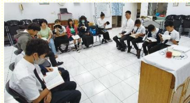
青少年區主日聚會

然而就在九月之後，我們發現孩子們的進步停滯了，因為缺乏在生活中有操練。經過服事者與