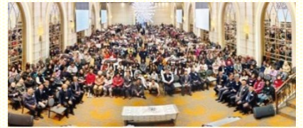
年終數算主恩聚會合影

本次年終數算主恩聚會，不僅是一頓豐盛的愛筵，更是一場屬靈的饗宴，是基督身體豐滿的顯出，是蒙恩的人一同來見證主的信實，並分享神在生活中的帶領與保守。聚會在喜樂與感恩中完滿結束，眾人也在盼望中迎接新的一年，期待在身體裏繼續經歷主更多豐富的供應與恩典。