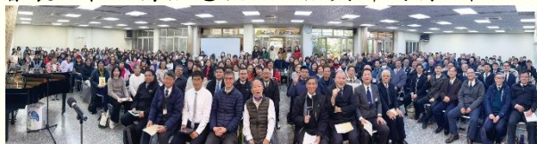
南大區半年度現場訓練合影

有、內住的基督，在我們裏面滿有復活的大能，使我們勝過死。第三篇信息再次看見人子行走在金燈臺中間，弟兄藉着八個問題，引導我們深入信息，看見眾召會雖在地上，行走在眾召會中的這一