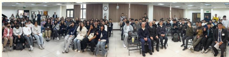
中學生寒假成全合影