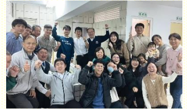
聖徒與得救新人合影

活中也能應用小排所讀的信息，操練把重擔卸給主，經歷主作安息。特別在末一週的排聚集中，有許多的新人也為其他福音朋友的得救禱告，而幾位福音朋友也藉着這些新人的盡功用而得救了。讚美神，五週的開展證明新路是可行的，新人走新路，新路得新人！ (一會所 曾子宇)