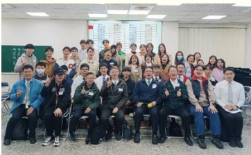
本地大專團聚合影

本 次南大區本地大專生團聚於一月三十一日在二會所舉辦，有三十一位學生，十四位陪同者，共四十五位聖徒參與。當中也有幾位是青少年、福音朋友、或是在桃園讀書但尚未返家的大專生。