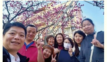
聖徒傳福音後合影

在基督徒的人生中，因為擁有這位主耶穌，無論遇到任何環境，都有神作我們的力量，使我們能信靠祂。腓立比四章十三節：