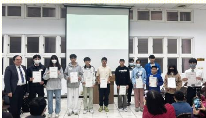
得榮少年證書頒發

本 次北大區青少年福音暨得榮少年頒獎聚會於一月三十一日在一會所舉行，與會得榮少年有六十四位，家長及親友四十八位，一同配搭的聖徒及關懷者八十五位，合計一百九十七位。聚會開始，先有得榮基金會的影片介紹。得榮少年專案除了提供獎助學金給清寒家庭或突逢重大變故之家庭的青少年，也藉由生命教育課程幫助青少年認識、尊重並思索生命的意義及認識自我價值，建立正確的價值觀，有正向的人生。