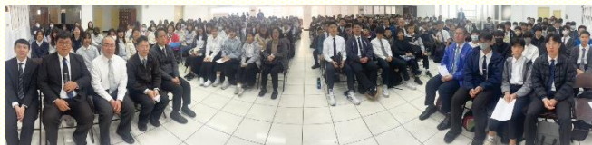
全召會中學生期初特會合影

這次中學生期初特會的主題是，『全力以赴、建造小排』。信息中說到希伯來十章二十四至二十五節，『且當彼此相顧，激發愛心，勉勵行善；不可放棄我們自己的聚集，好像有些人習慣了一樣，倒要彼此勸勉；既看見那日子臨近，就更當如此。』這給我們看見小排不是一般的聚會，乃是『我們自己的聚集』，彼此相顧、激發並勸勉這三件事也給我們看見，召會生活是非常有互相性質的。