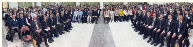
全臺得榮少年關懷者相調聚會合影

在第二篇信息更進一步說到，惟一蒙神祝福的工作，乃是建造神家的工作，得榮少年的工作並沒有在這獨一的工作之外。因此當我們服事時，需要考慮如何使他們進步。不僅僅是來參加聚會，更要在其中得着主，碰着主，摸着主，遇着主。關懷者們也需要受訓練，使這些青少年能向我們敞開，纔有機會更進一步的向主敞開。使他們能在召會中受成全，成為中幹，在基督裏成熟的獻上給神。