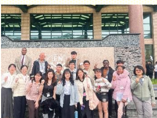
桃園參加聖徒合影

在前往特會途中，高速公路交通壅塞，使原訂上午十時的聚會行程，延至約十一時方能抵達。然而感謝主，藉着大會服事團隊即時的安排與快速反應，在漫長的車程與等候中，眾人能在遊覽車上連線參與直播，在靈裏與會場的聖徒一同聚集、同得供應。外面的環境雖有限制，但主的同在與說話卻不受攔阻，使眾人在過程中仍滿有享受。