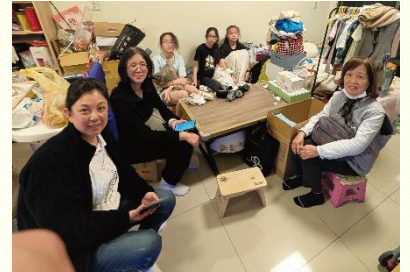
訪問得榮少年家庭

最近，在基督身體的交通中，其中一個小區得到一個可以接觸的得榮少年名單。另一個小區則完成了一個得榮少年家的關懷者變動交接，開始了之後的家訪及接觸。上個月得榮少年們參加了會所的集中主日暨福音聚會，會後也一同與聖徒們享受愛筵，感謝主，願主得着他們！