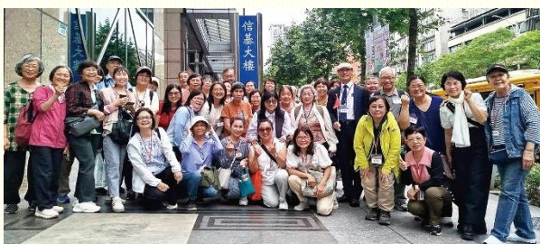
週中聖徒成全戶外教學合影