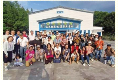
與草屯召會聖徒合影

交通與見證使我們彼此更相識、更相愛，也更珍賞主在各處的作為。草屯召會人人盡功用的傳揚福音，成為我們往前的榜樣與激勵。主阿，為着你的建造，願弟兄姊妹同心、同靈，作一個肯拼上去的人；也願弟兄姊妹們同心合意、人人盡功用，將神所賜的一千兩擺出來。盼望我們回來後在配搭中傳福音、牧養人、建造召會，在團體中一同蒙恩，讓主在地上得着祂的居所。（十二會所 賴軒忠）